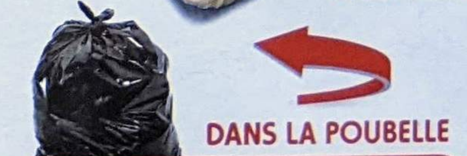
DANS LA POUBELLE