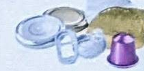
LES COUVERCLES, DOSETTES ALUMINIUM ET OPERCULES CANETTES