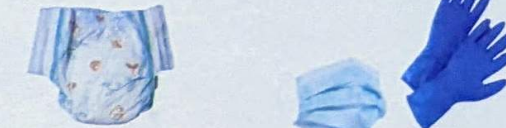
LES COUCHES ET PROTECTIONS HYGIÉNIQUES