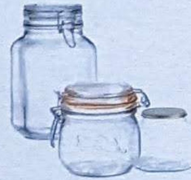
LES POTS ET BOCAUX