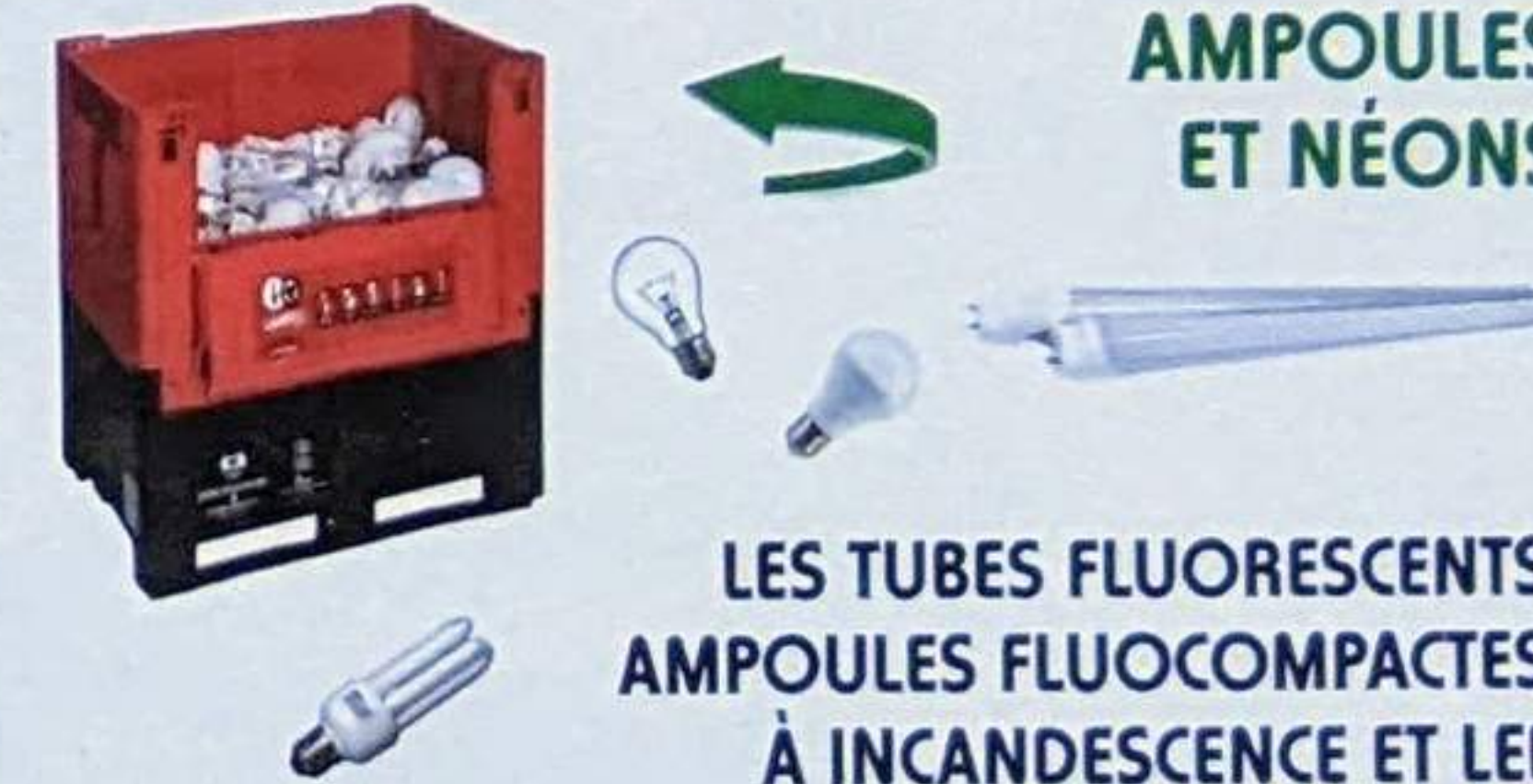
AMPOULES ET NÉONS