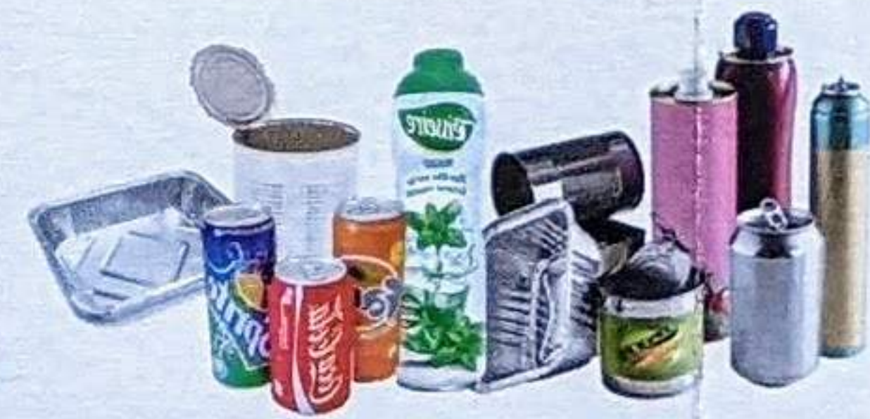
LES EMBALLAGES EN MÉTAL