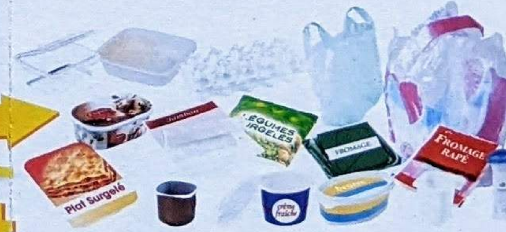
TOUS LES EMBALLAGES EN PLASTIQUE

! BIEN VIDER LE CONTENU, APLATIR ET NE PAS IMBRIQUER LES EMBALLAGES !