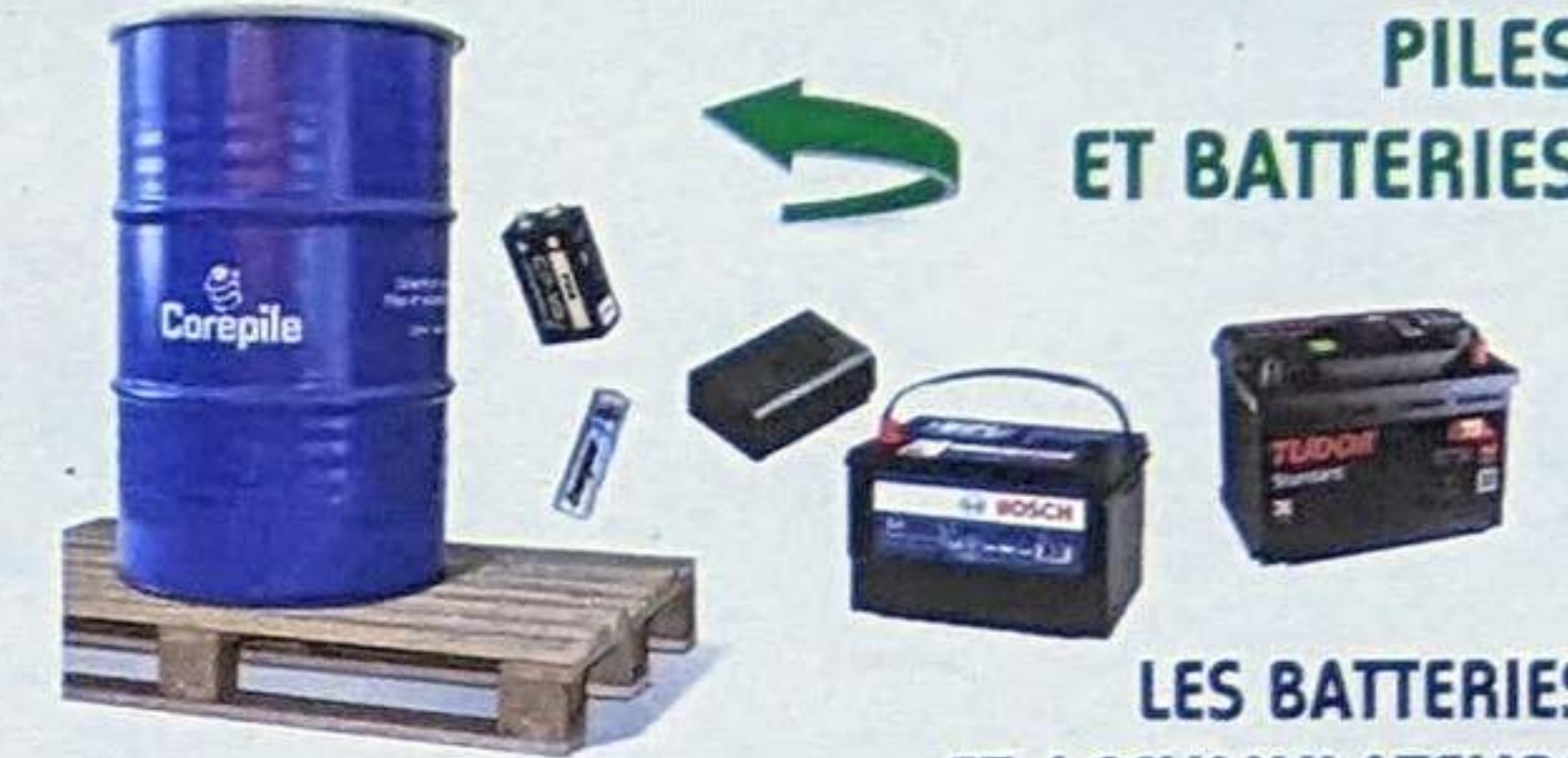
PILES ET BATTERIES