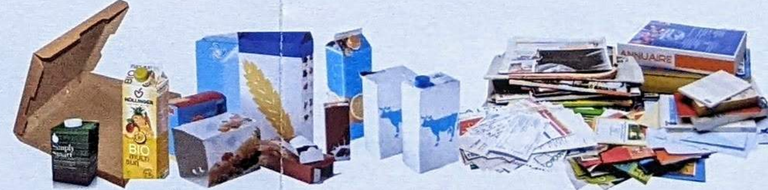
LES CARTONS, BRIQUES ALIMENTAIRES ET TOUS LES PAPIERS