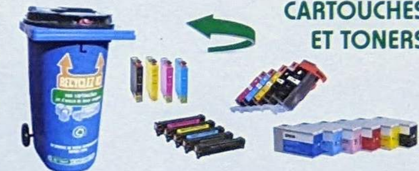
CARTOUCHES ET TONERS