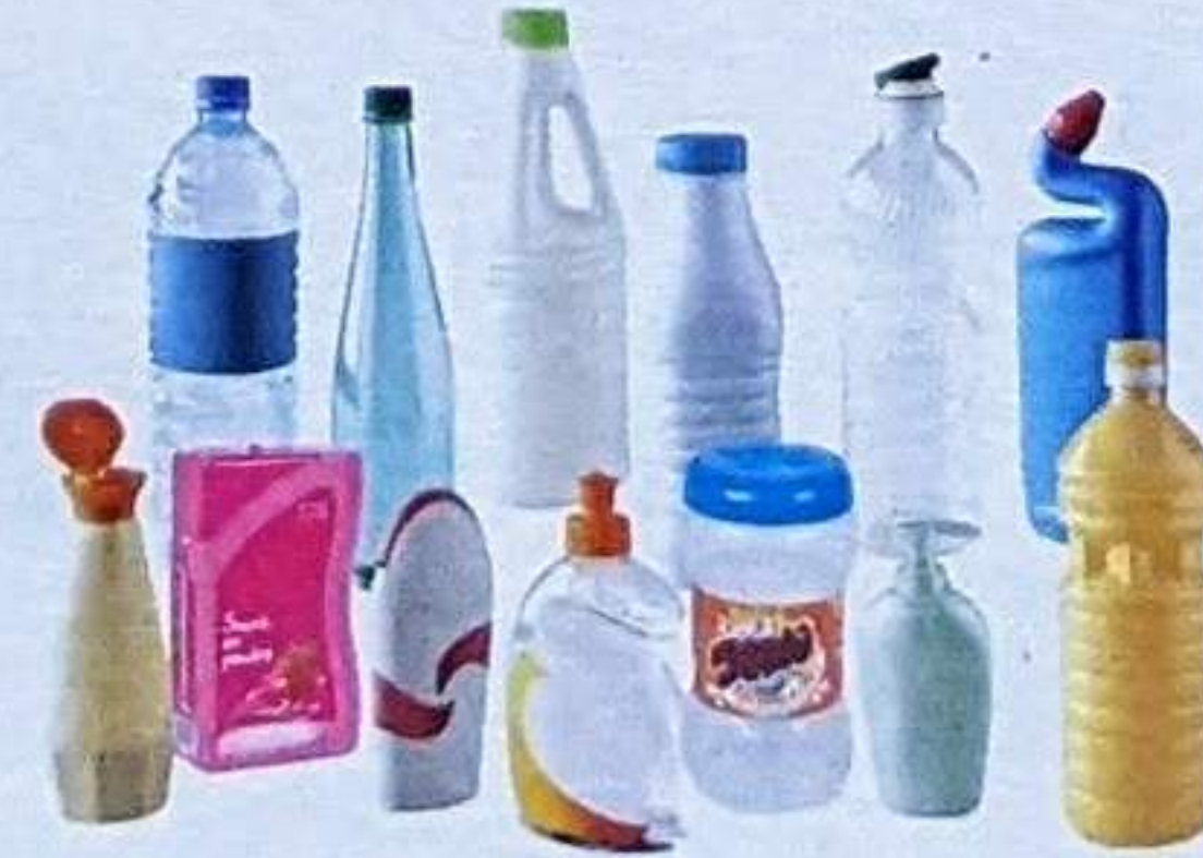
LES BOUTEILLES, FLACONS, BOÎTES