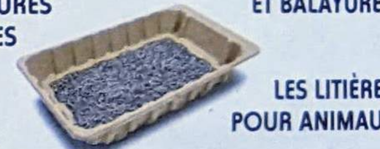
LES LITIÈRES POUR ANIMAUX