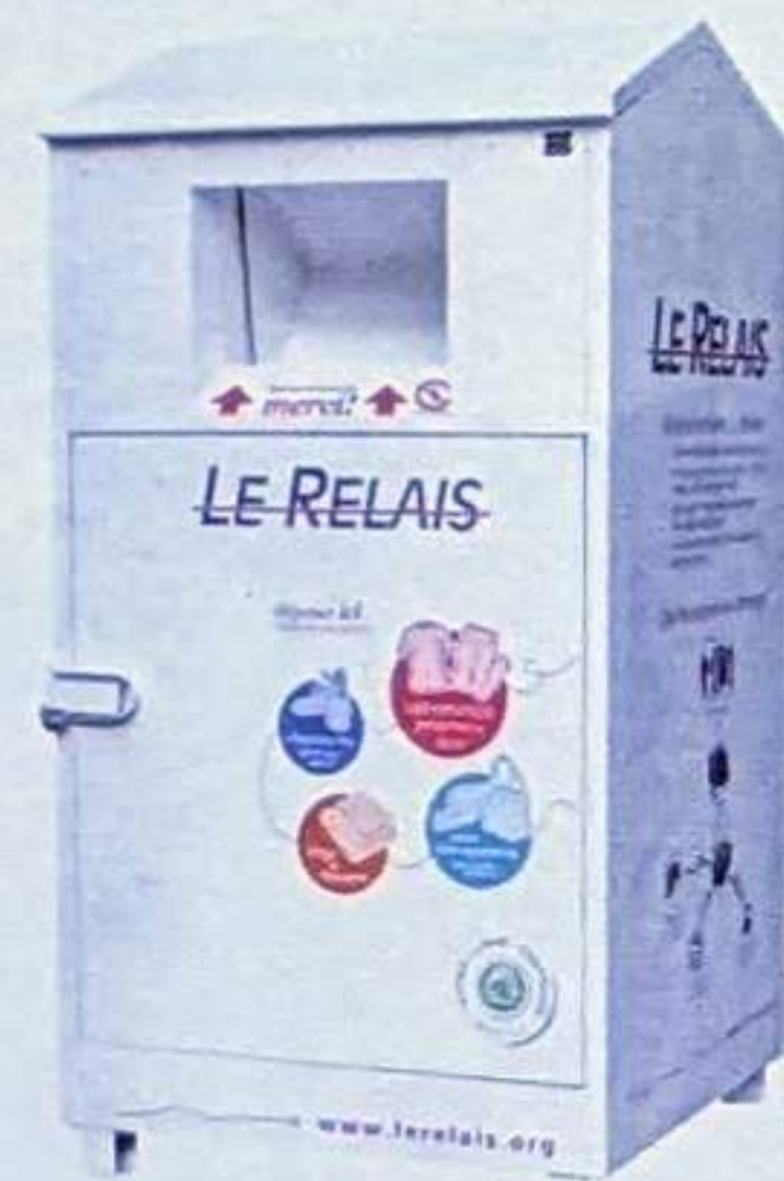
LES VÊTEMENTS, CHAUSSURES, DRAPS, COUVERTURES ET MAROQUINERIE